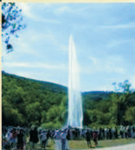
Der Geysir Andernach - der höchste Kaltwasser-Geysir der Welt - befindet sich in der idyllischen Landschaft des Rheintals in einem Naturschutzgebiet auf der Halbinsel „Namedyer Werth“.