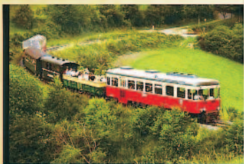
Vulkan-Express Die historische Schmalspurreisenbahn schlängelt sich von Brohl am Rhein durch das romantische Brohltal bis nach Engeln.