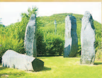
Vulkanpark „Vulkanen“ bezeichnet Spaß für die Familie von jung bis alt. Es steht für wandern, besichtigen, entdecken.